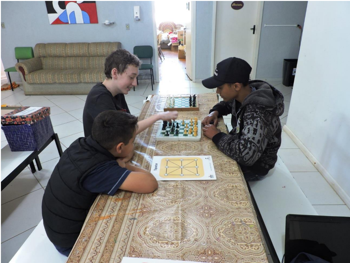
22/10/18: jogo STOP