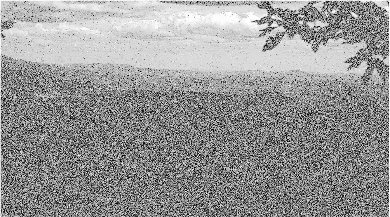
Figure 1. Wide Picture