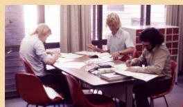
Biblioteca iniciou suas atividades no prédio da Escola de Engenharia

“Tudo começou em uma sala pequena... Hoje a Biblioteca do Instituto de Informática é referência Nacional!!! Espero que nos próximos anos a qualidade de seus serviços seja mantida e sempre renovada! Obrigada a todos profissionais: Bibliotecários, Assistentes Administrativos e Bolsistas, também aos Diretores do II e do SBU e ao corpo Docente, que com seu trabalho, colaboraram e colaboram, na construção e manutenção da Biblioteca do Instituto de Informática.”