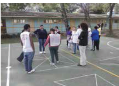
Jogo Vivo ou Humano

Figura 1 – Jogos lógicos de tabuleiro nas modalidades "gigante" e "vivo".