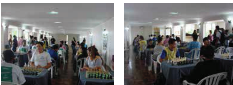
Figura 3 – Encontro de Xadrez, na AABB Comunidade de Porto Alegre, em 10 de dezembro de 2013.

de duração. No segundo semestre, os alunos da Escola Salomão participaram da “semente” de um Clube de Xadrez, com encontros semanais de 1 hora de duração, em que tiveram a oportunidade de desenvolver melhor suas habilidades neste jogo específico. Em outro momento, esses mesmos alunos atuaram como instrutores dos jogos aqui apresentados, incluindo o Xadrez, para uma turma de alunos da Escola Especial para Surdos Frei Pacífico, de Porto Alegre. Este processo culminou na participação dos alunos de ambas as escolas em um Encontro de Xadrez (mini-torneio), juntamente com alunos da Escola Municipal de Porto Alegre Nossa Senhora de Fátima e da anfitriã AABB Comunidade de Porto Alegre. Veja a Figura 3.